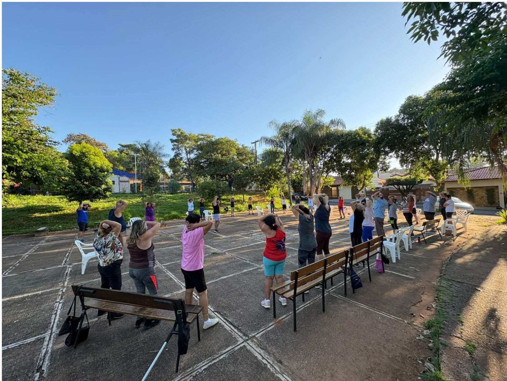
Figura 19. Atividade Estimulação Cognitiva – com a gerontóloga no dia 30 de março de 2026 no Distrito IV. Academia da Saúde - Gavioli.