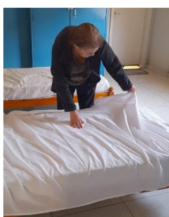
Organização da cama