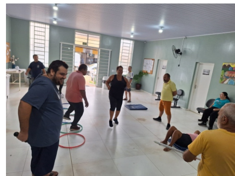
Grupo de Atividade Física