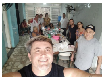
Aula De Dança