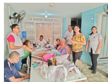
Momento de Confraternização