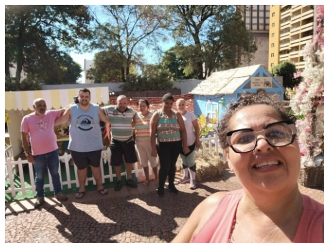
Grupo de Atividade Física