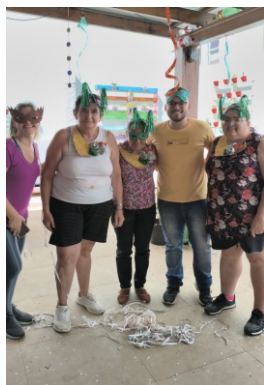
Grupo de Psicologia