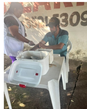
Coleta de Exames Laboratoriais