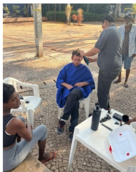
Cortes de Cabelo