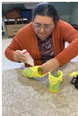
Oficina de Artesanato