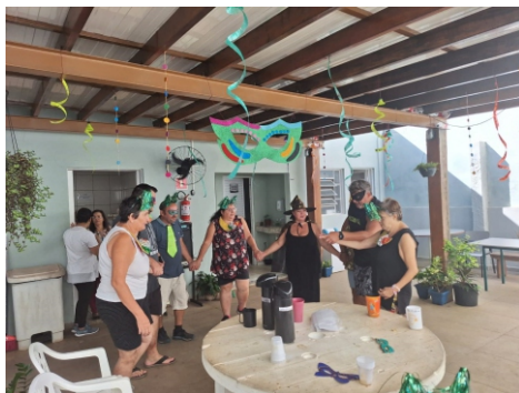
Grupo de Dança