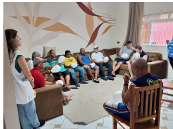
Dinâmica Educativa e Interativa