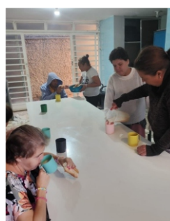
Café da tarde