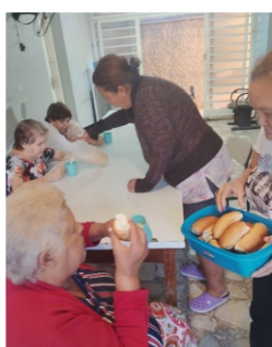
Café da manhã