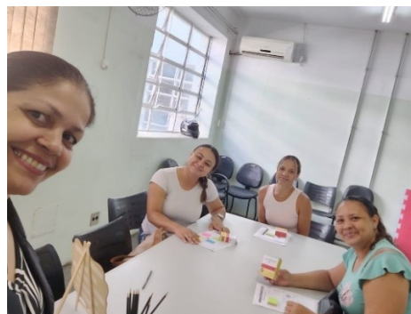
Projeto Acolher – Mães e Cuidadores