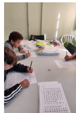
Grupo Mentes em Ação